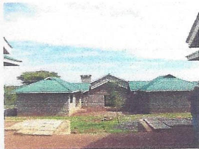
2. Etappe mit Küchenkomplex